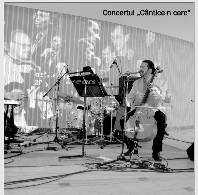
Concertul „Cântice-n cerc”