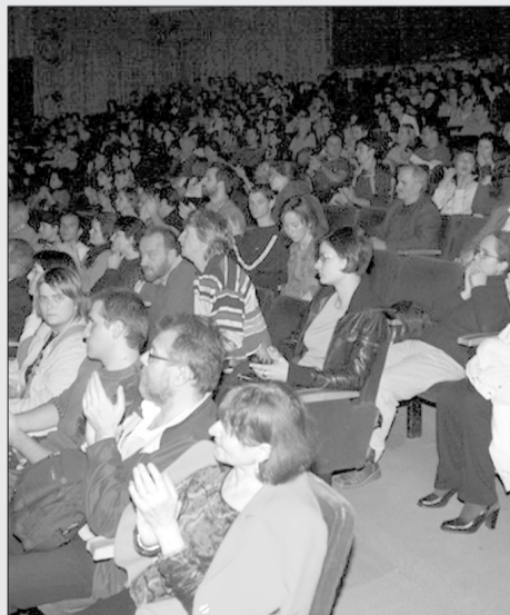
AFF 2006 Public numeros la Casa de Cultură din Sibiu