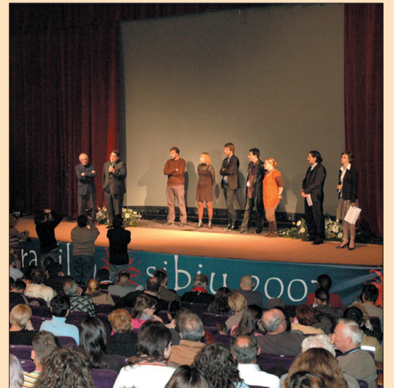
AFF 2007 premiera filmului „Război pe calea undelor“