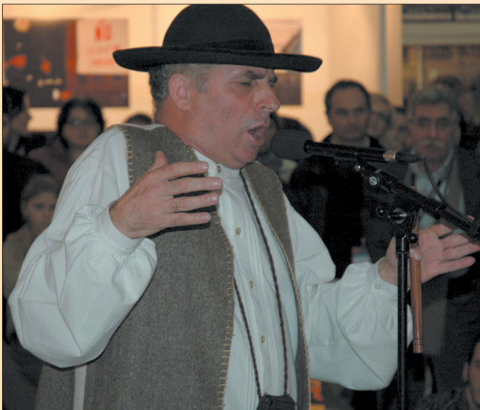
2007 concert Grigore Leșe

Retrospectiva Astra Film Festival în imagini