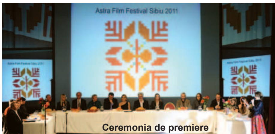
Ceremonia de premiere