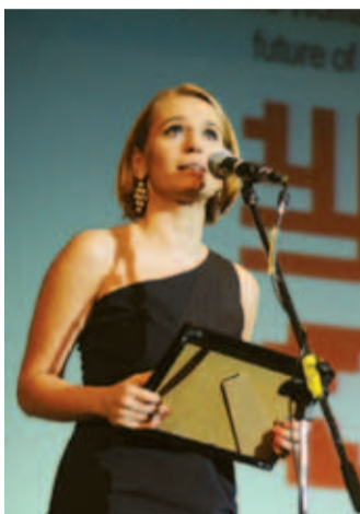
Andreea Esca („The One”)