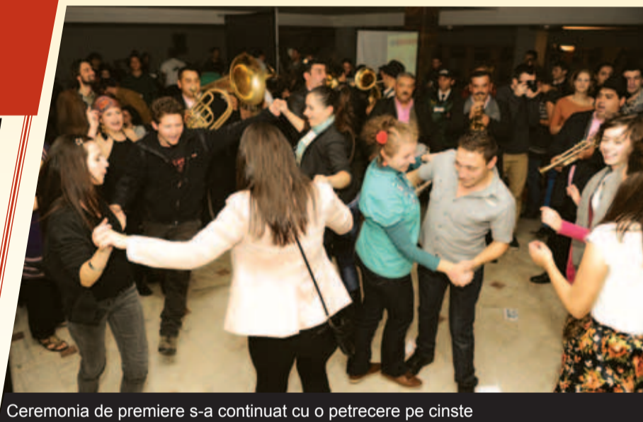
Ceremonia de premiere s-a continuat cu o petrecere pe cinste