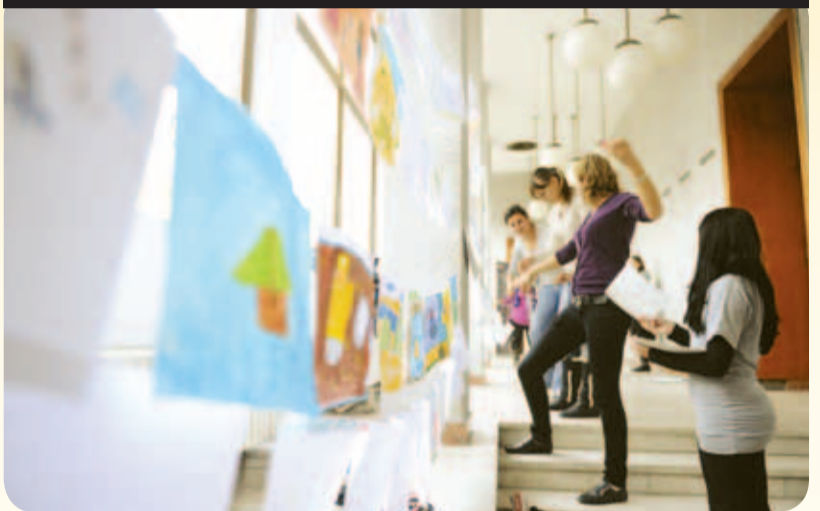
Desenele copiilor participanți la Astra Film Junior